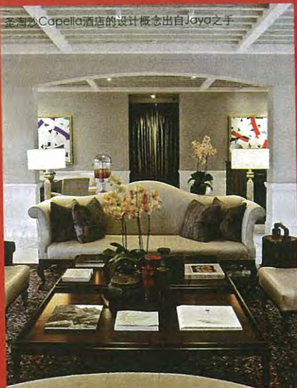
圣淘沙Capella酒店的设计概念出自Jaya之手

公司在2014年的计划，是增设更多陈列室，并让发展商更了解Jaya名下的酒店、住宅和度假Spas。目前，公司也为即将在2014年底开张的Patina酒店策划和筹备室内设计事项。